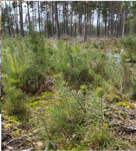
Douglasie aus Saat, vor der Wildlingsgewinnung, Anwendung/Abb. Ende März