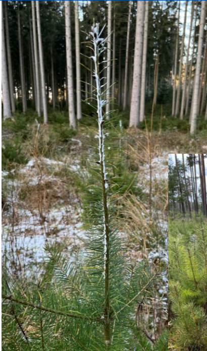
Douglasie Kultur, Anwendung/ Abb. Februar