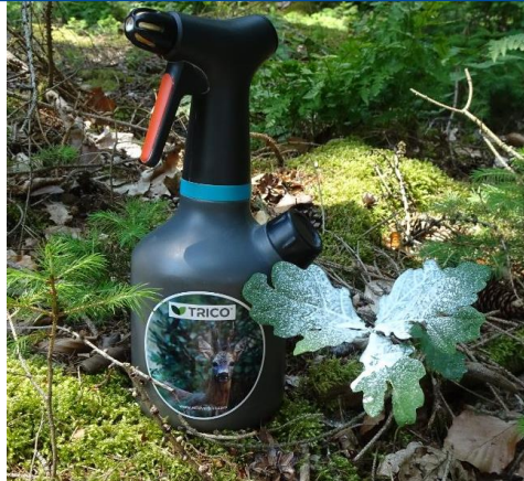
Eiche aus Hähersaat, Anwendung/Abb. Juni