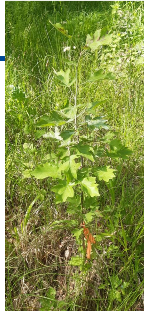
Elsbeere NV, Anwendung Anfang Mai, Abb. Anfang Juni