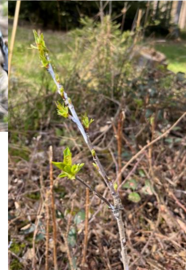
gleiche Fläche Kastanie, Abb. Mai