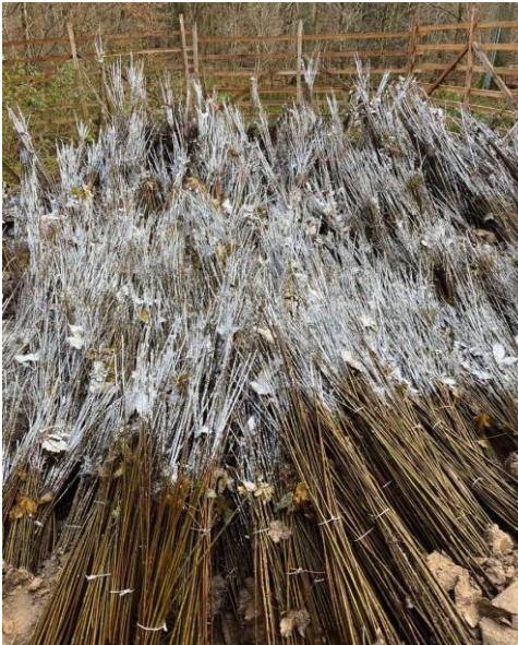
Ahorn Heister Einschlag/Abb. Nov.